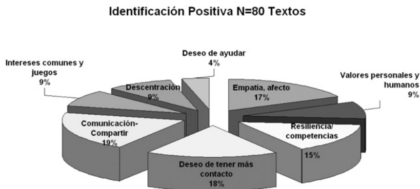
Gráfica No. 2. Identificación positiva de los niños y niñas participantes en el proyecto de Red Escolar

La capacidad de identificarse con el otro se dio en el 40% de los casos. Otro tanto mostró identificación negativa. La gráfica No. 2 muestra la distribución de la variedad de formas para buscar semejanzas, coincidencias, desde la identificación afectiva-empática que en algunos casos motiva el deseo de ayuda o el deseo de contacto, hasta la reflexión y evaluación existencial. He aquí algunos ejemplos: