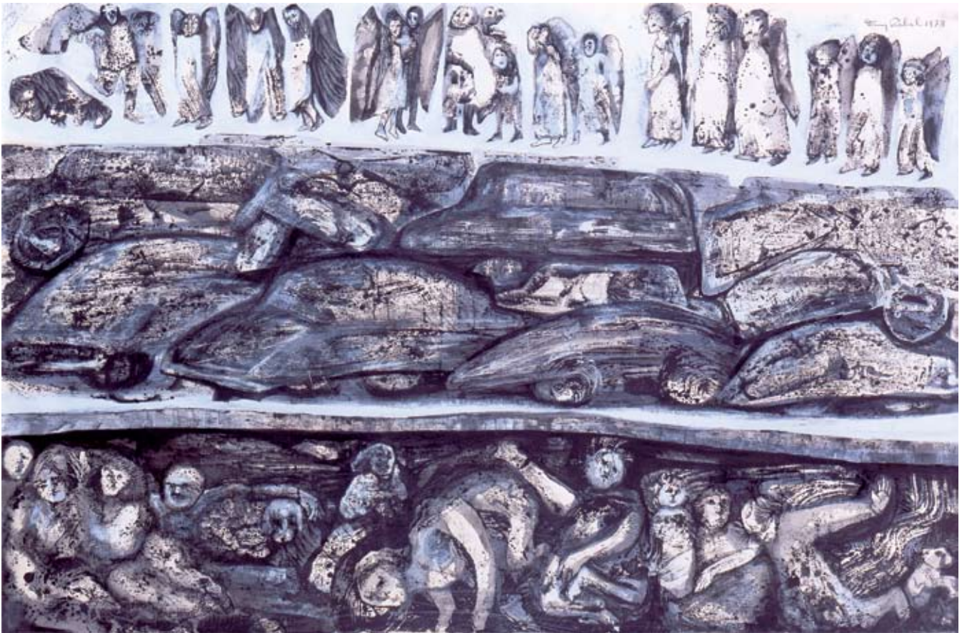
Rebelión de los peatones , mixta sobre papel, 53 x 80 cm, 1987