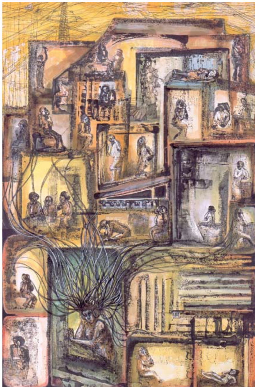
Las medusas , mixta sobre papel, 89 x 58 cm, 1985