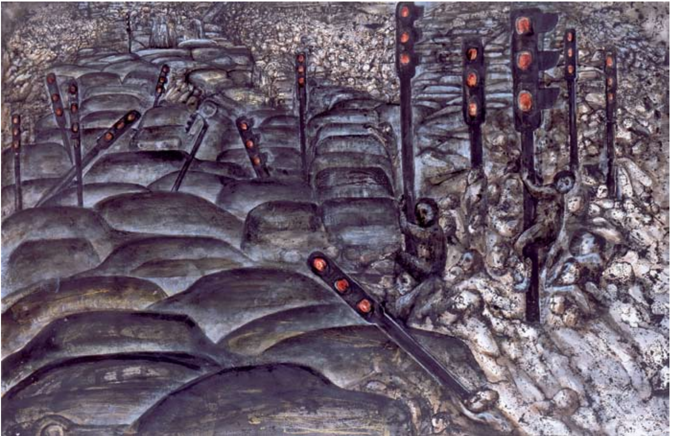
Los peatones van al cielo , mixta sobre papel, 58 x 88.5 cm, 1978