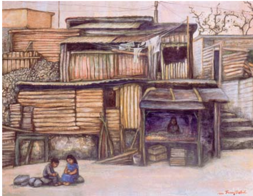
Sin título , acrílico sobre fibrasel, 60 x 80 cm, 1997