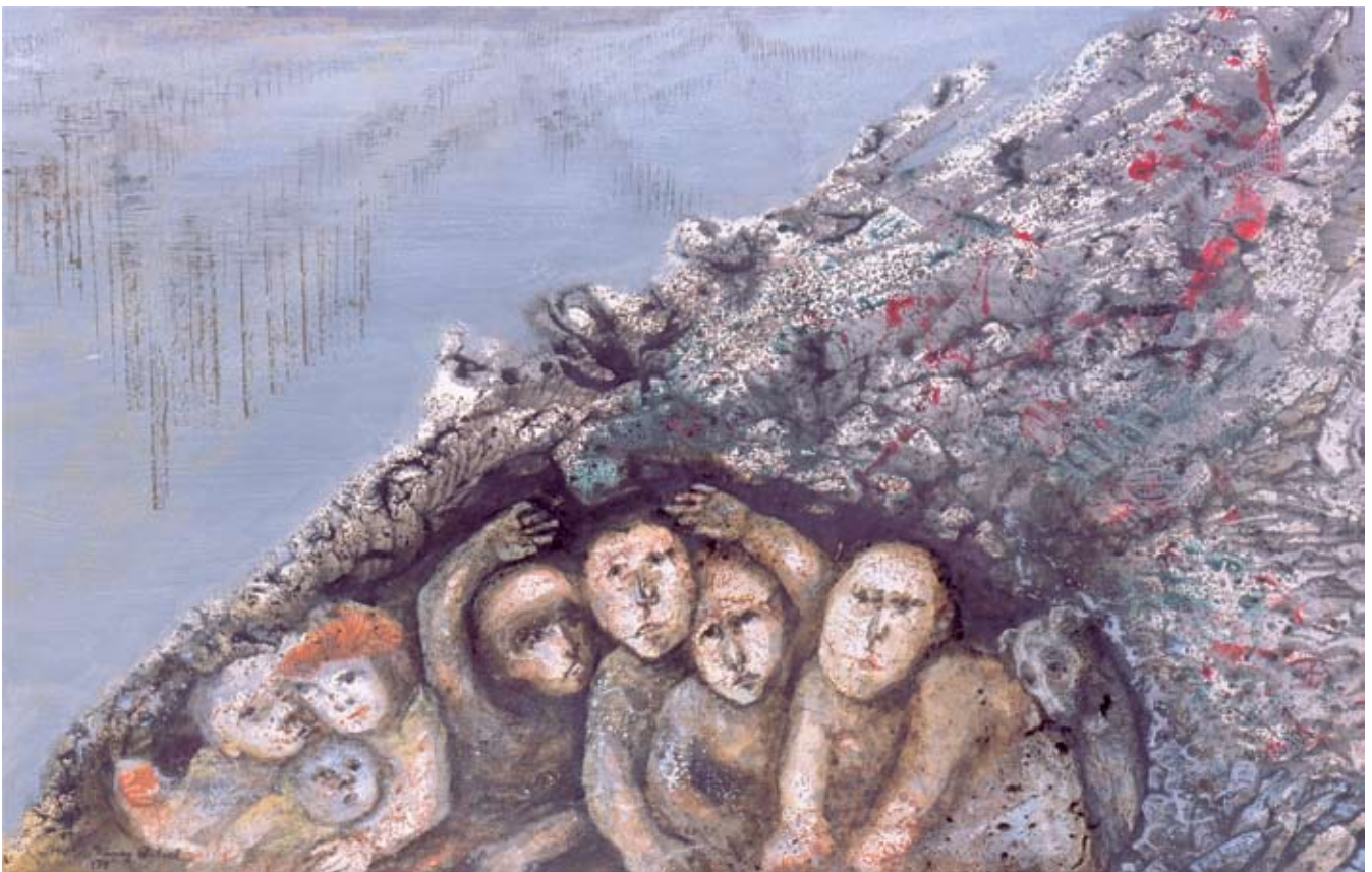
Industria en progreso, serie réquiem por la ciudad , acrílico sobre papel, 100 x 60 cm, 1978