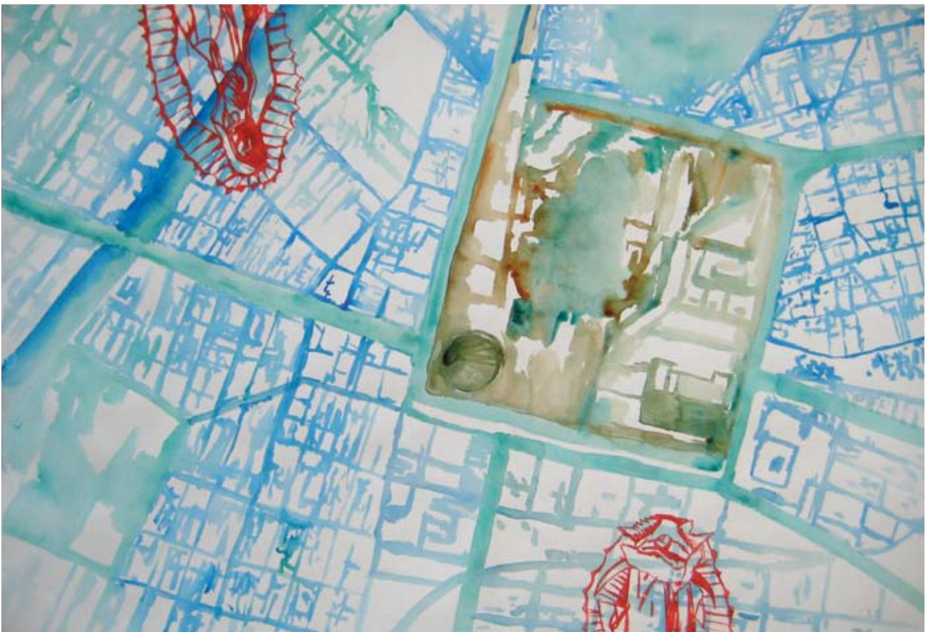
Santuario , acuarela sobre papel de algodón, 100 x 80 cm, 2007