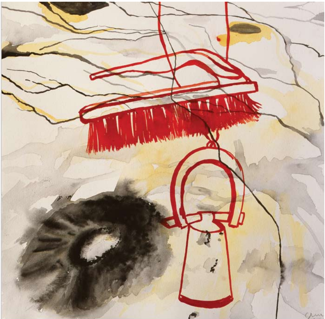
Paisaje aéreo II , acuarela sobre papel de algodón, 40 x 40 cm, 2006

Durante la adolescencia descubrí que existen varias maneras de resolver las dudas acerca del mundo y la existencia... Una de ellas es a través de la expresión plástica. Desde entonces las imágenes que plasmo reflejan mis cuestionamientos y reflexiones esenciales, aunque no siempre han sido procesos tan conscientes. Antes de ingresar a la ENAP tomé algunos cursos de dibujo. También me gustaba mirar libros de pintura. Años más tarde, cuando entré a la carrera de Artes Plásticas, confirmé cuál era mi vocación.