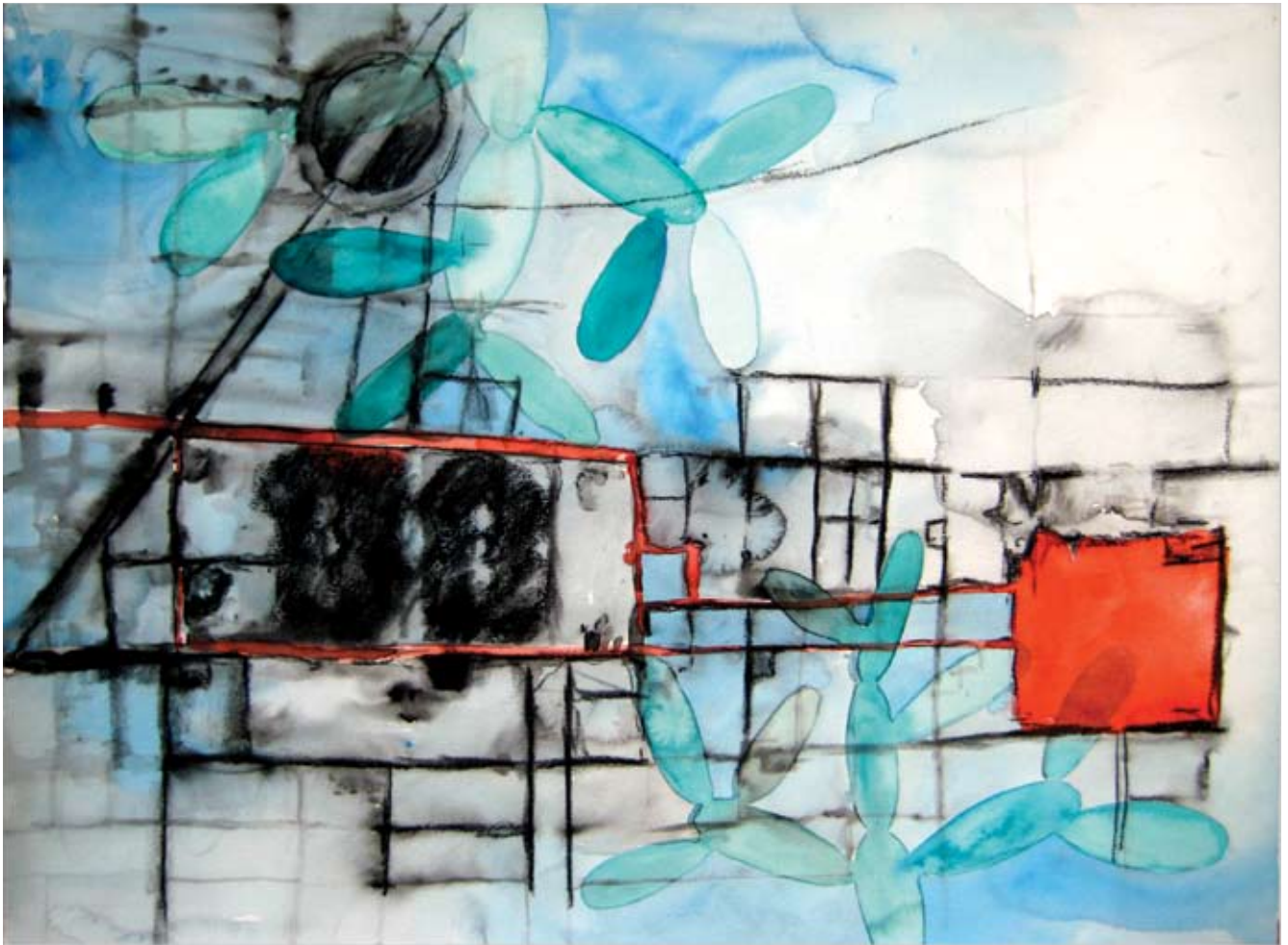
Recorrido , acuarela y carbón sobre papel de algodón, 60 x 40 cm, 2007