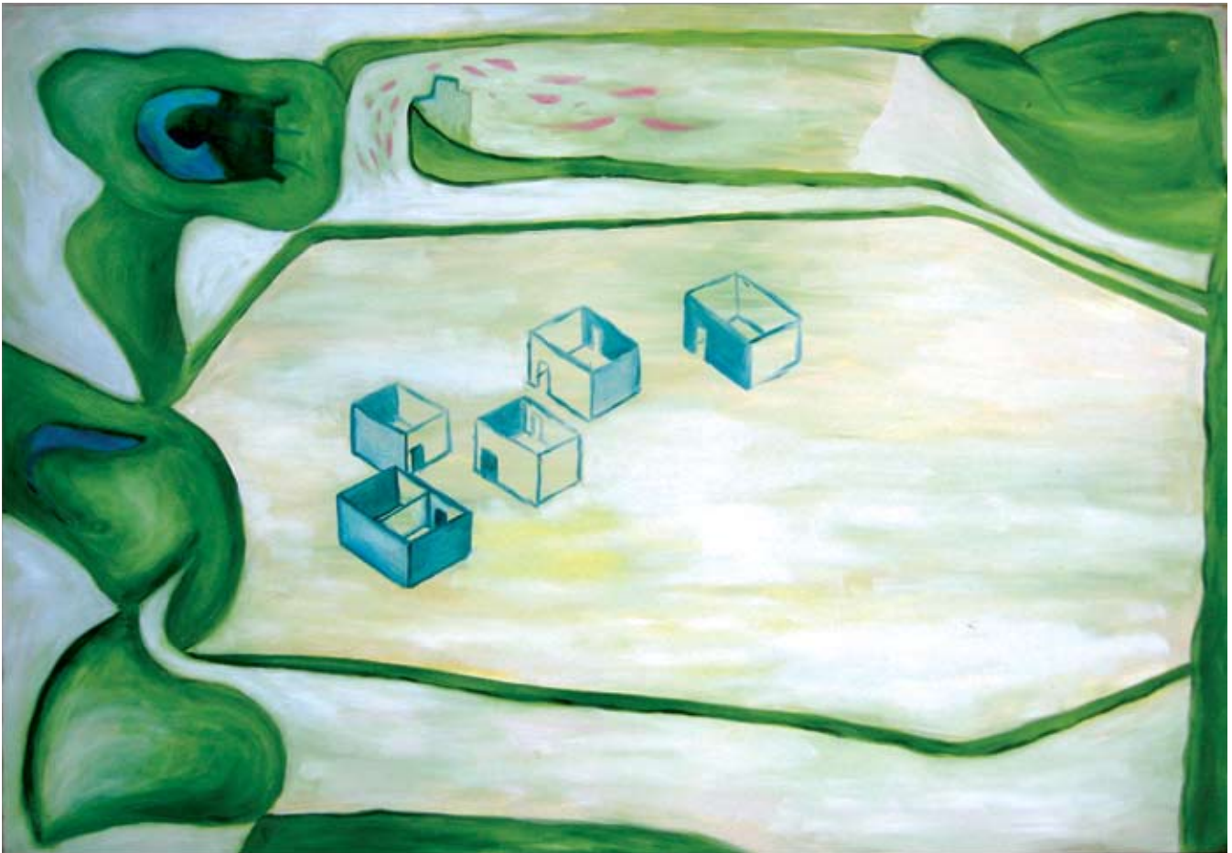
Casas , óleo sobre papel de algodón, 100 x 70 cm, 2007