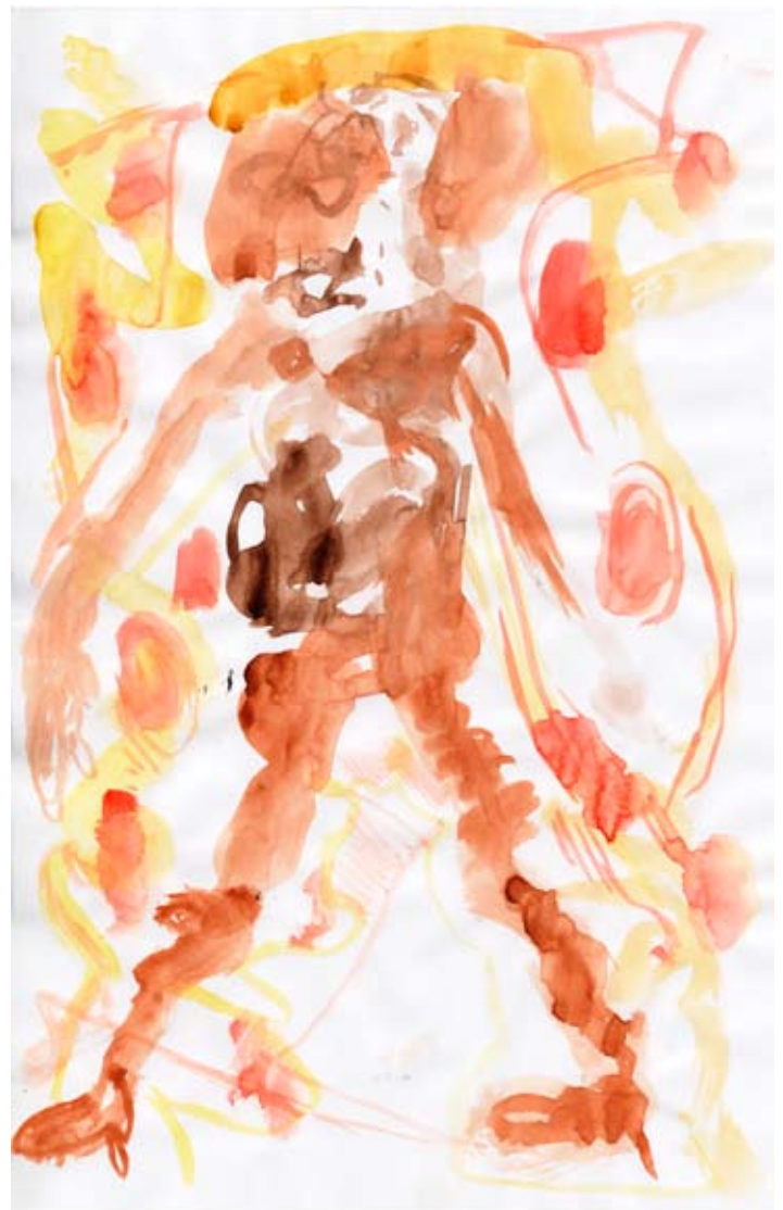
La pasarela 17, 2005