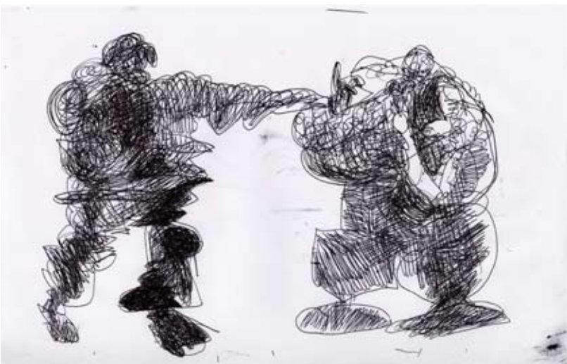
Adán y Eva 17, 2007

de 4 puntos del planeta nos va a mostrar que las diferencias entre personas producen una falta de entendimiento sistemático que se va a reflejar en violencia y tragedia. Dos países de Occidente, Estados Unidos y México, rico y moderno el primero, el segundo pobre todavía, aunque con pretensiones de alcanzar una modernidad que no sabemos todavía que tanto choque con lo más profundo de nuestra idiosincrasia, de ese llamado por algunos “México profundo”. Dos países de Oriente, Japón y Marruecos, con mucha riqueza y tecnología el primero, mientras que el segundo padece muchas carencias, como podemos ver en la forma de vida de esta familia marroquí que practica todavía una economía de trueque. Perfecta simetría inversa ésta que nos va a acabar mostrando muchas de las facetas del Choque de civilizaciones profetizado por el pensador estadounidense Samuel Huntington.