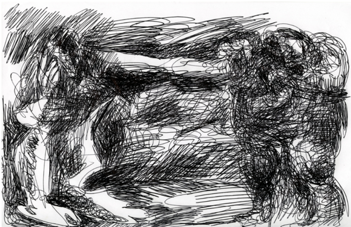
Adán y Eva 5, 2007