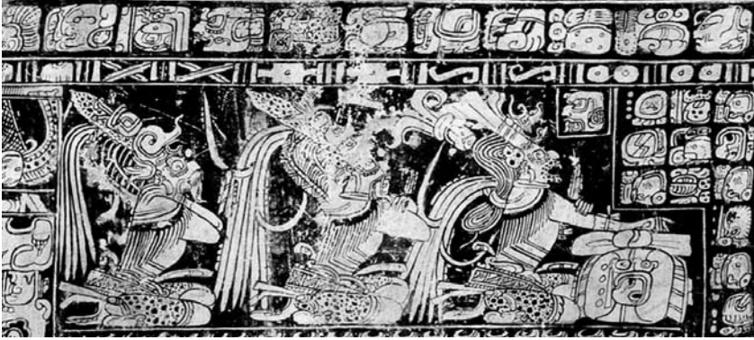
Fragmento del Vaso de los 7 dioses (Naranjo, RI Petén, Guatemala)

la vida y la muerte. Sólo así la posee y sostiene la existencia de su cuerpo que es, a un tiempo, el del relato que nos sujeta a su embrujo.