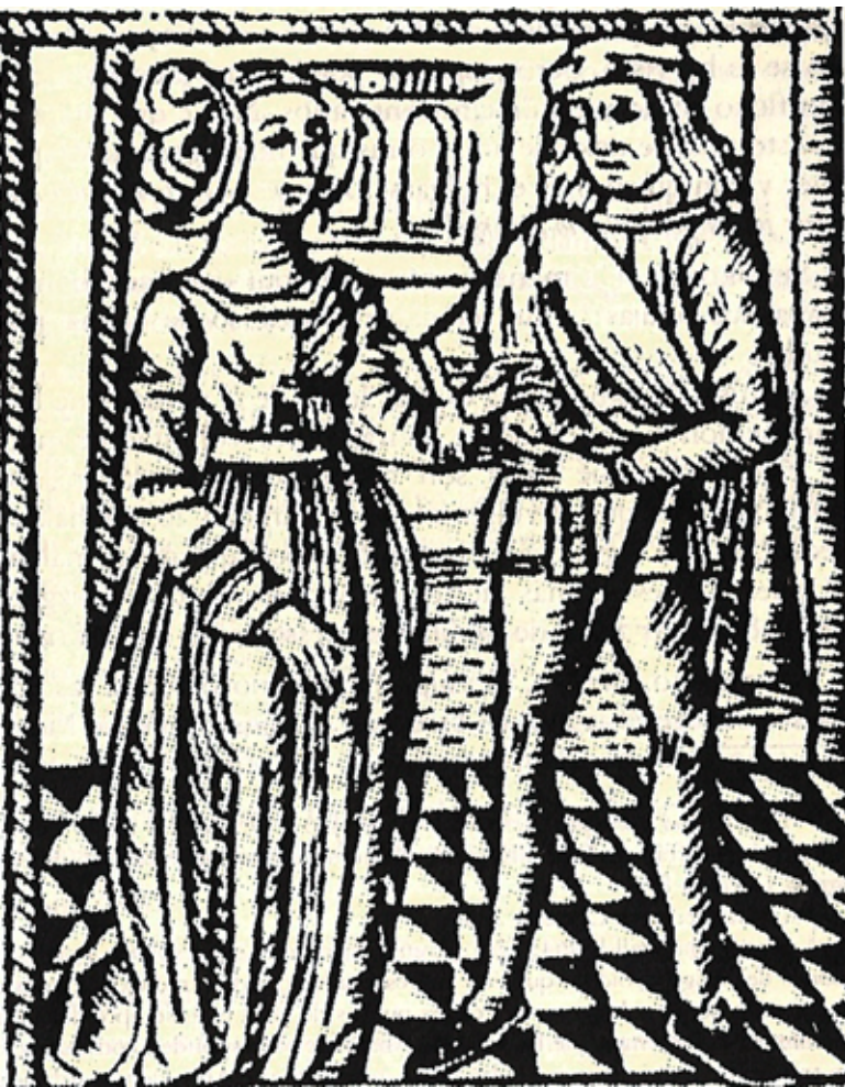
Grabado para la edición de 1499 de la Comedia de Calisto y Melibea

EN ARAS DE LA MOTIVACIÓN AJENA suele recomendarse: “vive la vida, estás joven, la vida es corta”, y la teoría se lleva a la práctica. De esta manera, las palabras del poeta romano Quinto Horacio Flaco se convierten en realidad mediante el carpe diem , locución latina que significa “aprovecha el día”, darle buen uso en un sentido de utilidad. Entonces, vivir no es sólo respirar, sino transformar, y ello concierne, por supuesto, al espíritu y a la razón, no todo puede ser víscera. Dicho tópico se pone en acción en la reciente novela de Margarita Peña, El amarre , con personajes que viven con intensidad sus propios intereses y eso les permite crecer y encontrar nuevas razones para continuar transformándose y comprender que lo importante no sólo es lo aprendido, sino su aplicación.