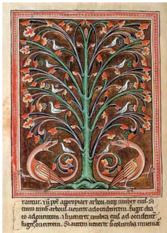
Bestiario de Oxford, s. XVI

A pesar de que hay decepciones, engaños, infidelidades, golpes al corazón, al cuerpo, pócimas que quién sabe si hayan surtido su efecto, siempre está la dinámica de la vida. Ningún personaje se estanca, parece que les inyectaron la energía de los veinte años. En voz de la protagonista, el tópico que aquí funciona como motivo dinámico de los personajes así se plantea: “Busqué en el laberinto una respuesta que me aclarara el misterio de la vida, la amistad y la muerte, que me sirviera de paliativo. Carpe diem fue la contestación. Cortar la rosa ahora que somos jóvenes (...) Divertirnos como chiquillos, que- rernos como adolescentes, amarnos en momentos fulgurantes. Fue