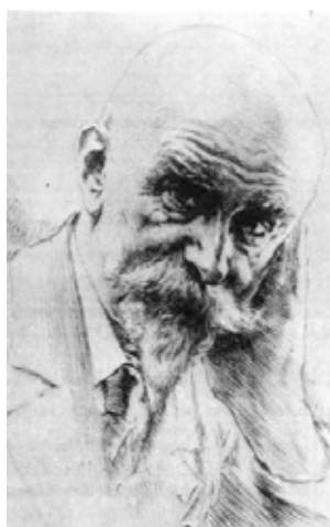
J.-K. Huysmans por Chahine

1867. En la Revue Mensuelle ( Revista Mensual ), del 27 de noviembre, aparece su primer texto, titulado “Des paysagistes contemporains” (“Los paisajistas contemporáneos”).