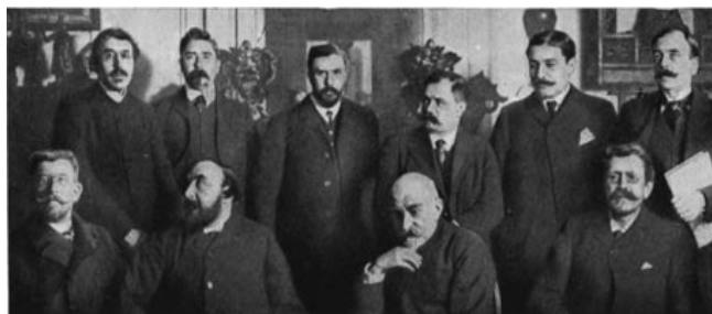
La Academia Goncourt en 1903

de noviembre. Se le descubre cáncer al realizársele una operación en la boca.