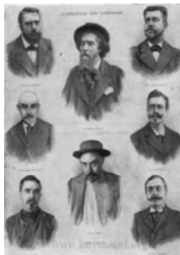
La Academia Goncourt en 1896

1903. Aunque las disposiciones de la voluntad última de Goncourt relativas a la Academia fueron ejecutadas, la institución no goza de reconocimiento oficial debido a que debía conformarse de acuerdo con las prescripciones de la ley de asociaciones. El 19 de enero Emile Combes firma el decreto oficial en el que acuerda la autorización en cuestión –à fortiori– de la utilidad de su “equipo público