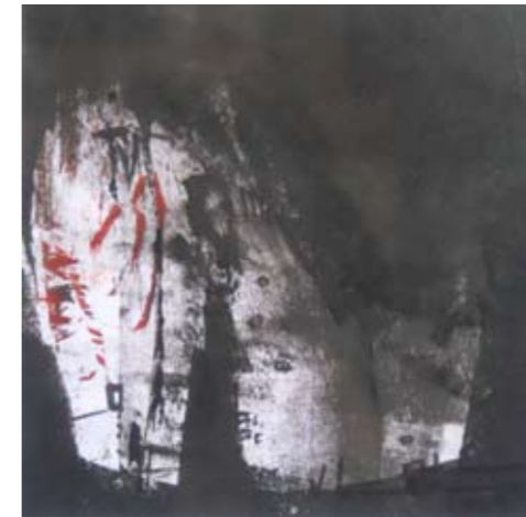
TINTA LITHOS SOBRE PAPEL 33 x 33 CM 2009

ESTROFA DEL POEMA CIMA, DESOLACIÓN, 1922.