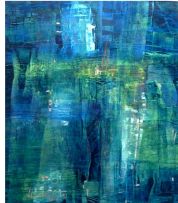
ÓLEO SOBRE PAPEL 47 x 52 CM 2005

ESTROFA DEL POEMA LAGO LLANQUIHE, POEMAS DE CHILE , 1967.