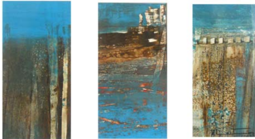
TRÍPTICO ÓLEO SOBRE PAPEL 36 x 51.5 CM 2009