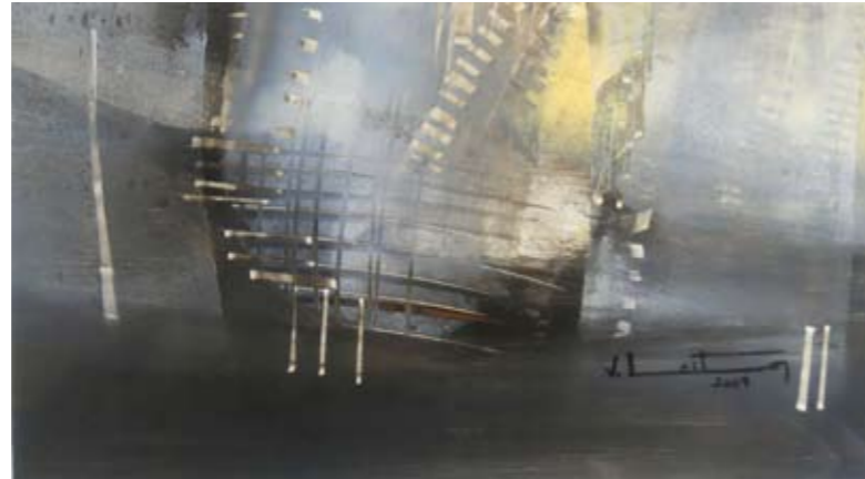
ÓLEO SOBRE PAPEL 32 x 49 CM 2009