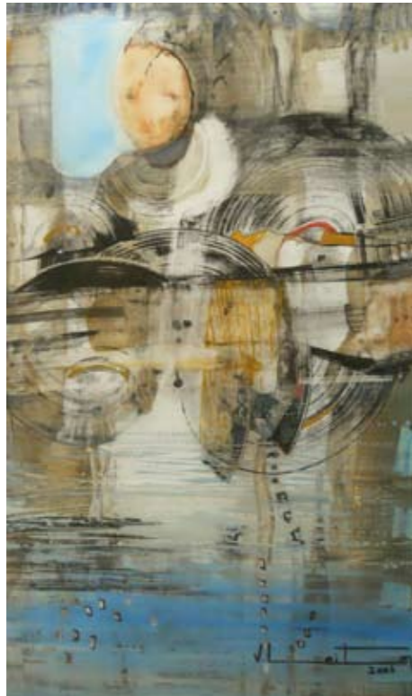
MIXTA SOBRE PAPEL 50 x 36 CM 2005