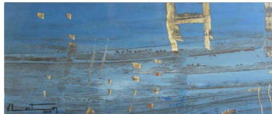
ÓLEO SOBRE PAPEL 34 x 51.5 CM 2009

ESTROFA DEL POEMA EL BARCO MISERICORDIOSO, DESOLACIÓN, 1922.