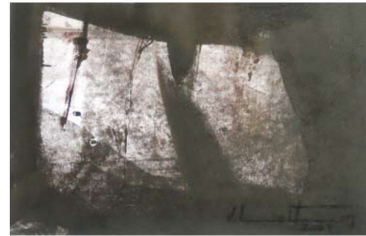
TINTA LITHOS SOBRE PAPEL 32 x 37 CM 2009