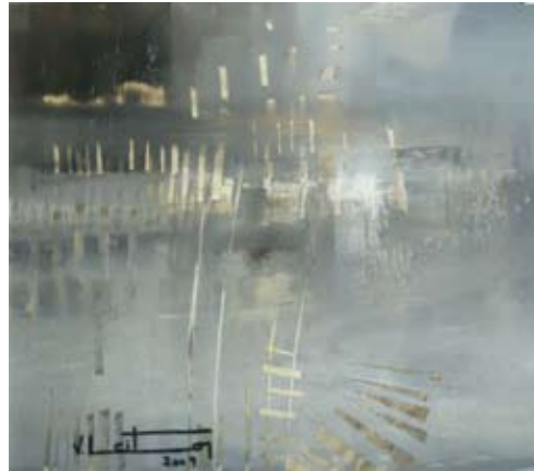
ÓLEO SOBRE PAPEL 32 x 34 CM 2009

ESTROFA DEL POEMA LA LLUVIA LENTA DE SU LIBRO DESOLACIÓN , 1922.