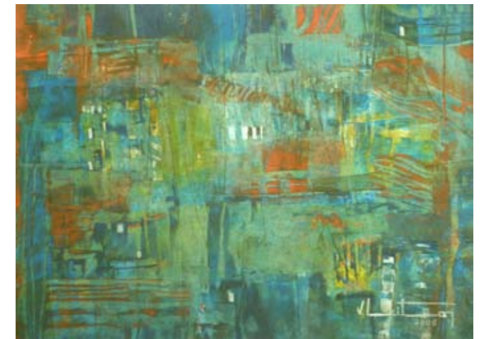
ÓLEO SOBRE PAPEL 53 x 38 CM 2005