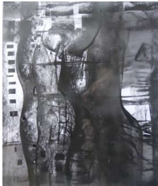
CARBONCILLO SOBRE PAPEL 43 x 39 CM 2009