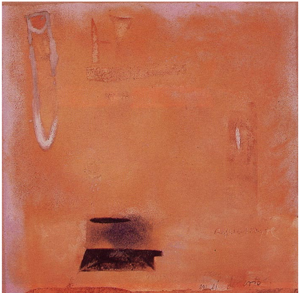
Aguasangre , óleo/tela, 130 x 130 cm