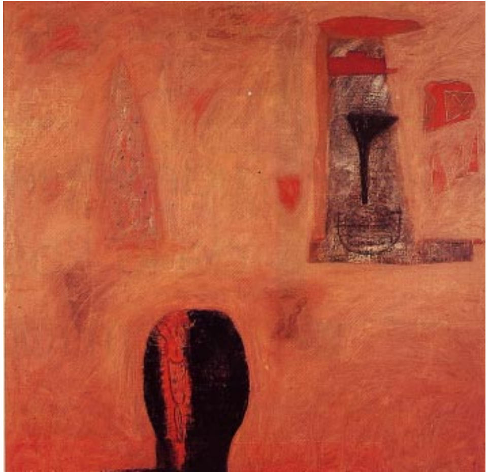
El poeta y su luz , óleo y encáustica, 130 x 130 cm

El pintor hace una auscultación de una geografía íntima: el agua, la noche, el viento, la erosión. Estos elementos acompañan sus paisajes, donde se subraya el refinamiento de la luz —eje fronterizo entre lo concreto y lo abstracto— y, además de la determinación en la sobriedad de la línea, predomina el dibujo de trazo libre, las texturas de valor táctil, una pincelada irreductible que traspasa el color azul de ritmo fauvista, la crudeza de un amarillo azufrado, el cromatismo pálido de los rojos, el contraste matizado entre el azul ultramar y los tonos oscuros. La energía de la gama colorística es rotunda y se intensifica en la medida que observamos la cadencia de la composición. Las asociaciones cromáticas de su obra valen por