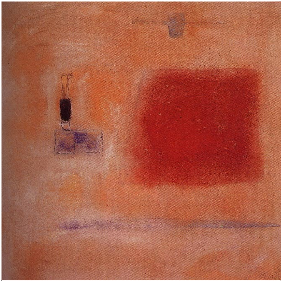
Laguna venezolana , óleo/tela, 130 x 130 cm