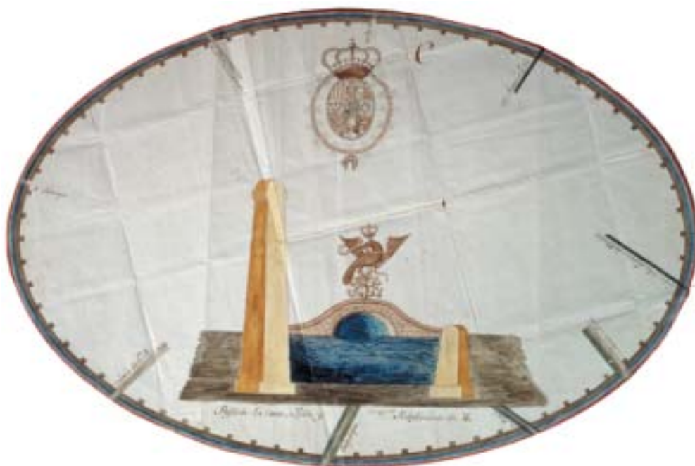
Plano semicircular ú ovalado de la cerca que se propone para el resguardo de las Alcabalas de México

Los 54 planos se presentan en el libro en el siguiente orden: Trato a indios; Intendencia de México; Caminos; Obras hidráulicas; La ciudad y sus curatos, plazas y jardines; Palacios; Casas; Casa de Moneda; Real Fábrica del Tabaco; Arquitectura religiosa, a través de sus iglesias y capillas, colegios y hospitales; Milicia y tribunales; Garita.