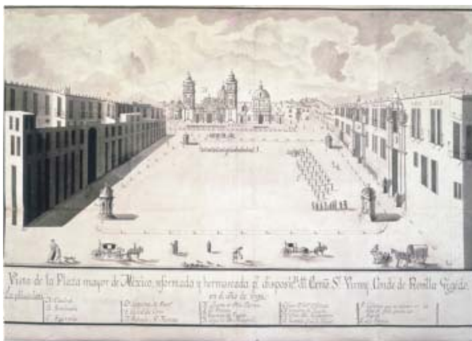
Vista de la Plaza mayor de México reformada y hermo세ada por disposición del Excelentísimo Señor Virrey Conde de Revillagigedo en el año de 1793 67 X 45 cm, 1793 MP, México, 446