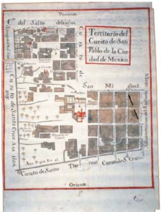
Plano del Territorio del Curato de San Pablo de la Ciudad de México 1781 06 26 [Con] I, MP, México, 705

La colección bibliográfica Corpus Urbanístico de México presenta este segundo volumen titulado Corpus urbanístico de la ciudad de México en el Archivo General de Indias , el cual tiene un carácter espectacular, a partir de dos aspectos. El primero se debe a que es la primera ocasión en la cual se muestra este material agrupado, que es una parte del acervo que sobre la ciudad de México se encuentra en ese archivo. El otro aspecto es la divulgación del material seleccionado en reproducciones fotográficas en tela y de gran tamaño, que se presentó en una magna exposición inaugurada en el Museo Nacional de Arquitectura, del Palacio de Bellas Artes de la ciudad de México, en octubre de 2002.