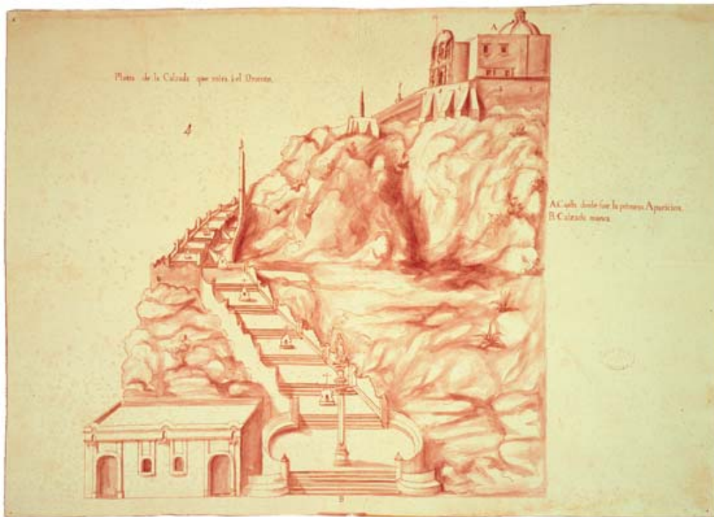
Plano de la Calzada Nueva que mira á el Oriente (De la Capilla de el Cerrito de Nuestra Señora de Guadalupe)