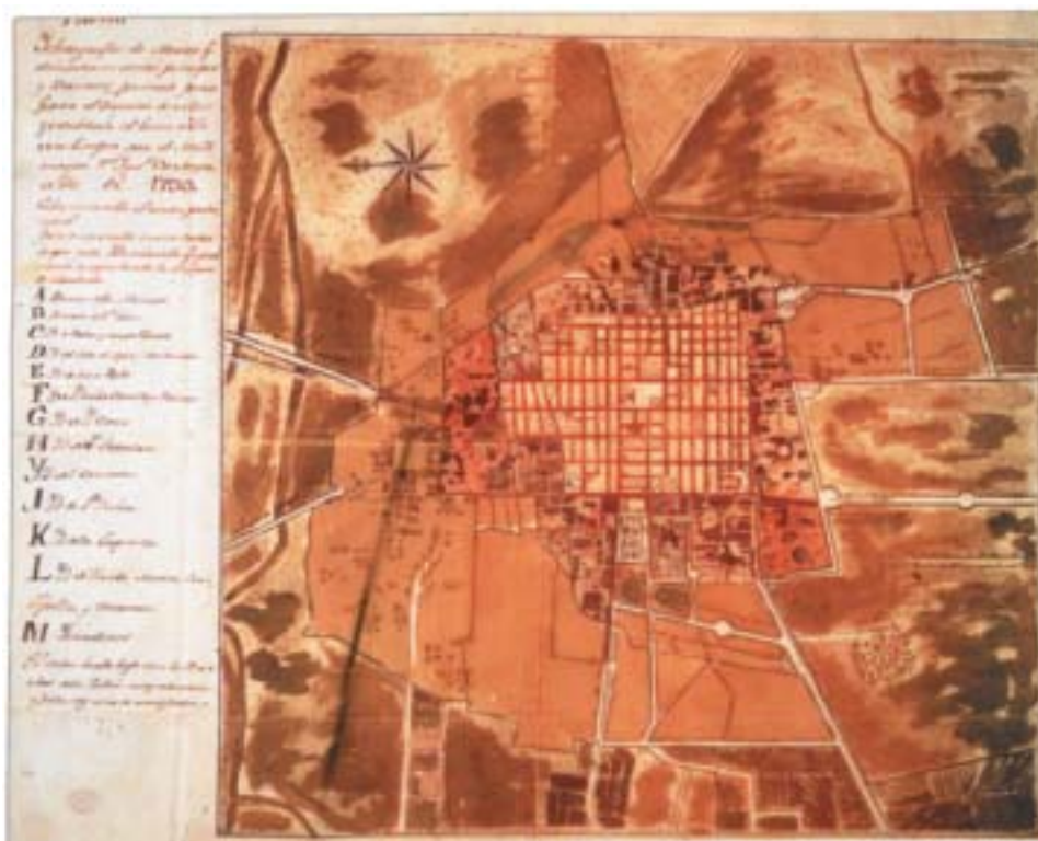
Plano Ychnografico de Mexico que demuestra su centro principal y Barrios, formado para fixar el termino de estos y establecer el buen orden de su limpia 60 X 46 cm, 1793, MP, México, 444

La exposición, que nos honró presentar el Museo Nacional de Arquitectura en el bello recinto del Palacio de Bellas Artes, es la continuación de otra muestra presentada hace dos años en ese mismo sitio y titulada Corpus Urbanístico de Puebla y Oaxaca en España . Ambas exposiciones son el resultado del profundo interés y recursos de la Universidad Autónoma Metropolitana y la Embajada de España en México, cuya