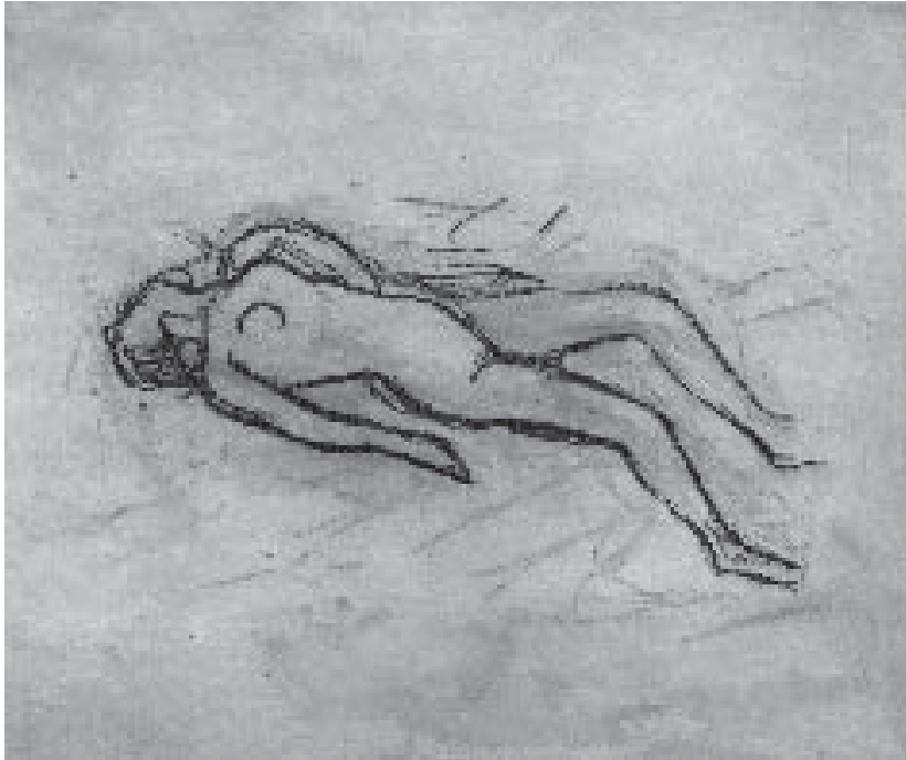
Juan Soriano, Sin título , fotograbado y agua tinta, 25 x 30 cm, 2004

caba estrepitosamente con una realidad histórica que no podía ignorarse. En aquel momento no existían las condiciones para poder asimilar con profundidad una renovación de tal envergadura. No podía elegirse uno solo de los caminos como el apropiado. Ambos eran necesarios, pues se complementaban.