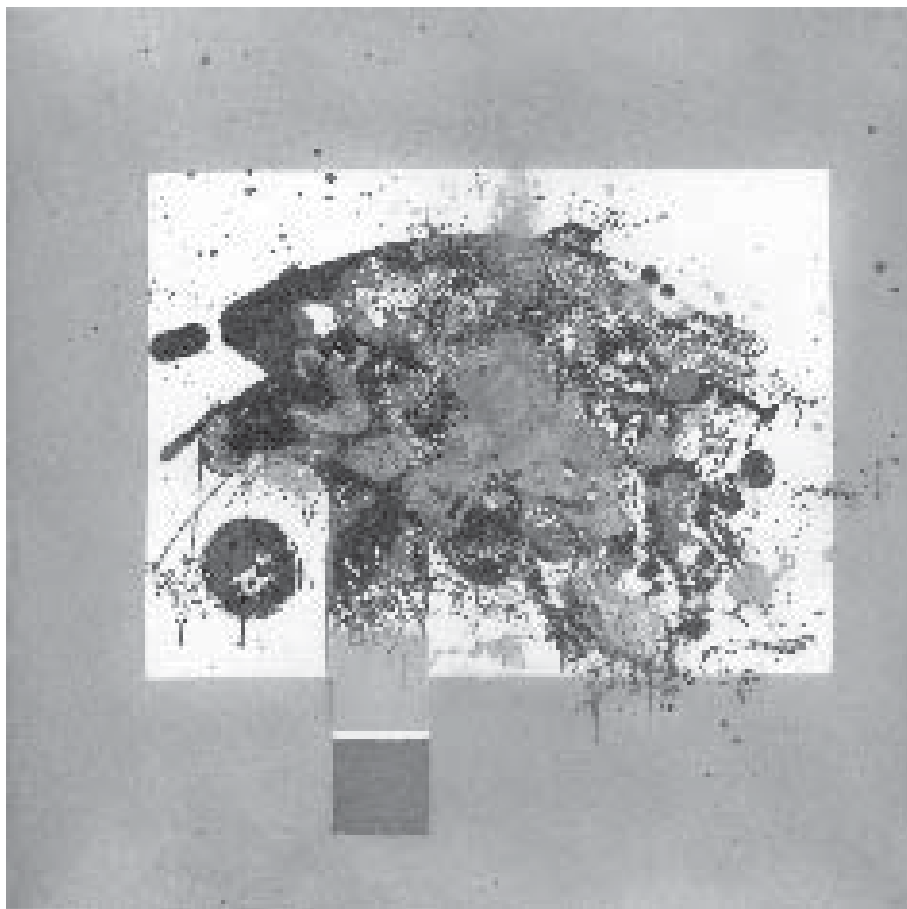
Manuel Felguérez, Sin título , aguafuerte y agua tinta, 30 x 30 cm, 2003

En el Onzeno Auto la alcahueta corre a decir las buenas nuevas a Calisto, quien, enfermo de amor como está, atina todavía a preguntarle: "¿[...] te veo alegre y no sé en qué está mi vida?" Celestina responde con tres palabras: "En mi len-