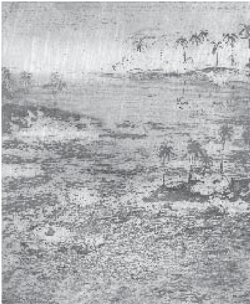
Manuela Generali, Bahía , agua tinta, 30 x 24.5 cm, 2003

te—. La interpretación de los datos resultantes constituyen la base para determinar políticas gubernamentales más adecuadas y efectivas para el logro de una mayor igualdad; del mismo modo, sirve a los interesados en general para evaluar los resultados de las medidas tomadas o, en su caso más frecuente, reconocer las oportunidades perdidas.