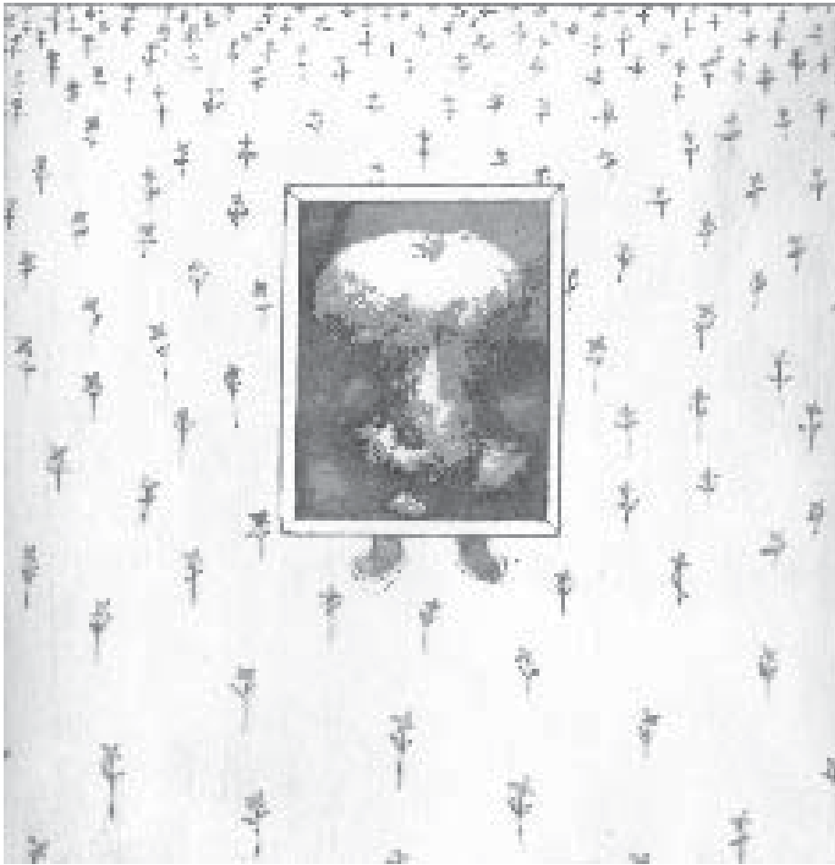
Boris Viskin, Bomba atómica disfrazada de Pú , fotograbado, aguafuerte y punta seca, 30 x 30 cm, 2003

nores de un año y esperanza de vida al nacer, derivada de la maternidad); b) indicadores de educación (tasas brutas de matriculación en la escuela primaria, analfabetismo de adultos, porcentaje de alumnos que llegan al quinto grado de la escuela primaria); c) indicadores de salud reproductiva (alumbramientos por cada 1,000 mujeres de entre 15 y 19 años de edad, uso de anticonceptivos, tasa del VIH, tasa de fecundidad total, partos atendidos por personal capacitado); d) indicadores demográficos, sociales y económicos (porcentaje de población urbana, tasas de crecimiento urbano, población agrícola por hectárea de tierra cultivable y de tierra cultivada permanentemente, ingreso nacional bruto per cápita , 20 consumo de energía per cápita , 21 acceso a agua potable, gastos del gobierno central en educación y salud, asistencia externa para actividades de población). 22