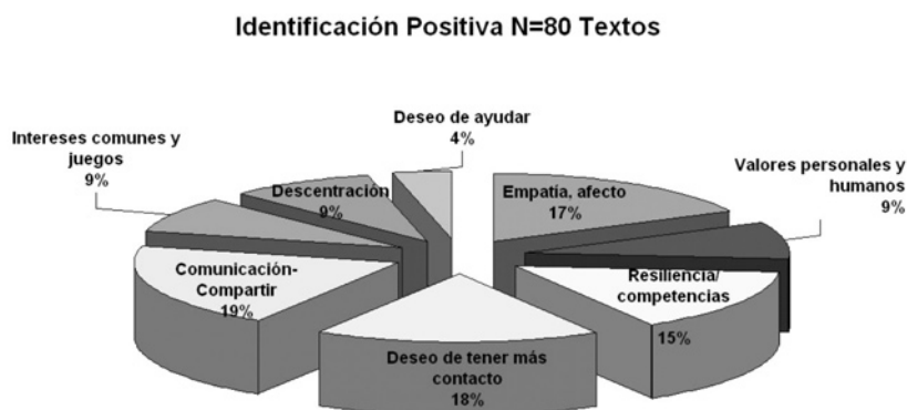
Gráfica No. 2. Identificación positiva de los niños y niñas participantes en el proyecto de Red Escolar

La capacidad de identificarse con el otro se dio en el 40% de los casos. Otro tanto mostró identificación negativa. La gráfica No. 2 muestra la distribución de la variedad de formas para buscar semejanzas, coincidencias, desde la identificación afectiva-empática que en algunos casos motiva el deseo de ayuda o el deseo de contacto, hasta la reflexión y evaluación existencial. He aquí algunos ejemplos: