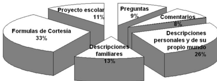
Gráfica No. 1. Interés de los niños participantes del Proyecto Red Escolar en el mundo del Otro