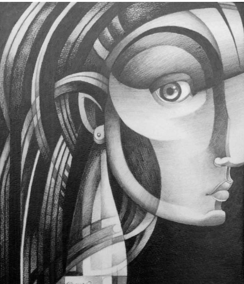
Rostro de mujer, lápiz s/papel, 30 x 36 cm