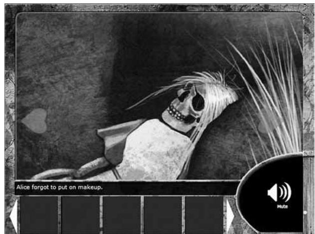
Alice Is Dead