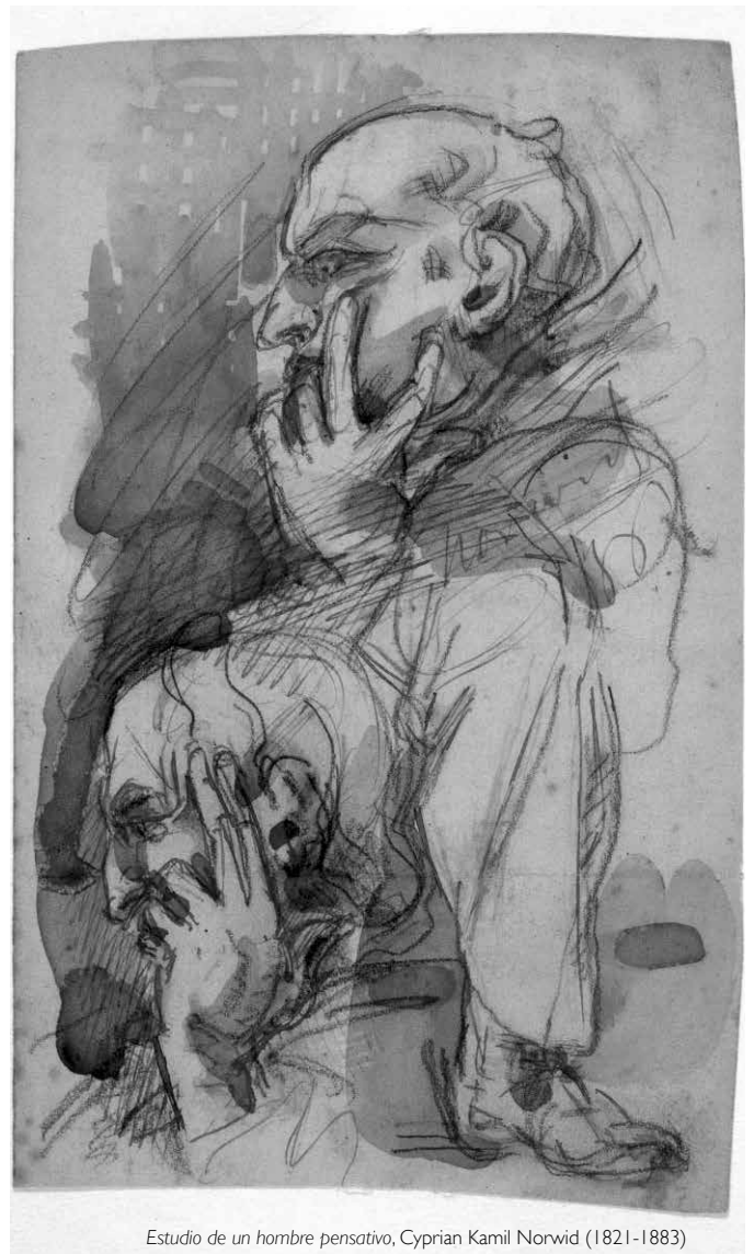
Estudio de un hombre pensativo, Cyprian Kamil Norwid (1821-1883)